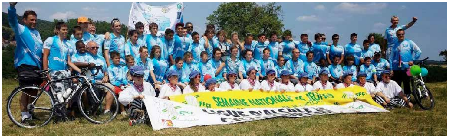
Ci dessus : Délégation LIF à la Semaine Nationale des Jeunes