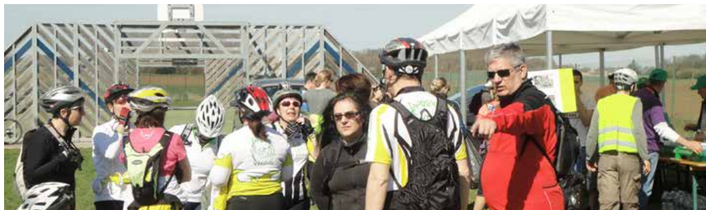
A l'heure d'affluence, au point d'accueil de Sivry