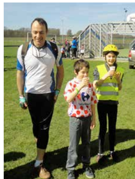
De la graine de champion